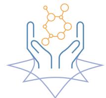
HEALTHY AGING E MEDICINA RIGENERATIVA