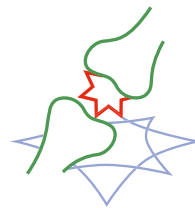
MEDICINA DEL DOLORE/ORTOPEDIA/ REUMATOLOGIA