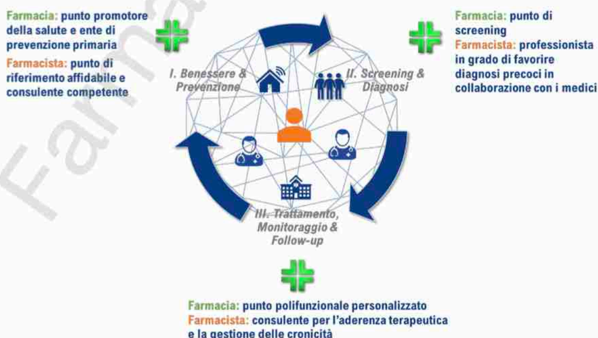
Fig. 7

Tale ruolo delle farmacie è stato anche ribadito in un recente Report di Meridiano Sanità nel quale sono state individuate numerose proiezioni inerenti al posizionamento e al ruolo della farmacia nel Servizio Sanitario Nazionale e del farmacista che rispondono alle esigenze di sostenere le politiche per il benessere e per la prevenzione, di screening e di diagnosi precoce per il trattamento, il monitoraggio e il follow-up (fig. 7).