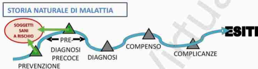
Fig. 6

Con riferimento proprio all'evoluzione della malattia cronica, i punti di maggiore incidenza nei quali l'azione professionale del farmacista diventa efficace sono la fase di prevenzione e la fase di pre-diagnosi ( fig.6 ), perché il farmacista può intercettare e in tal modo orientare il soggetto ad una diagnosi precoce oppure al ravvedimento per quanto riguarda gli stili di vita con un riallineamento a condizioni di normalità.